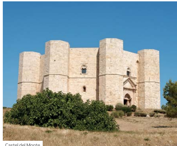
Castel del Monte